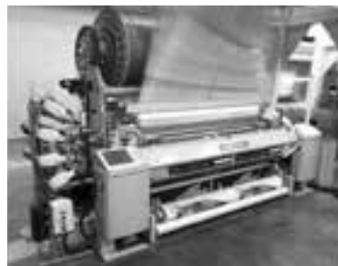
ماشین حوله‌بافی دورنیر مدل FT

که بدون کاهش سرعت ماشین کوبش نرم دفتین را ارائه می‌دهد که این امر کیفیت بالای حوله را ایجاد می‌کند. پس از توضیحات فنی ماشین، فرماندار آذرشهر به سخنرانی پرداختند که مهمترین نکات در زمینه ارتباط شرکت‌های تولید کننده تبریز با کشورهای اروپایی از جمله آلمان را در راستای بالا بردن فناوری کشور مهم دانستند. وی با اشاره به اینکه دولت تدبیر و امید به دنبال ایجاد رونق اقتصادی است، بالا بردن کیفیت جهت صادرات را امری مهم در این زمینه توصیف کرد.