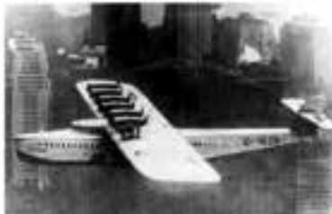
بزرگترین هواپیمای دنیا در سال ۱۹۳۰ با قابلیت حمل ۱۸۰ مسافر

شده کرنی می باشد. وی در ادامه به ماشین های بافندگی دورنیر اشاره نموده که امروزه ماشین های رپیری مثبت و همین طور ماشین های جت هوای این شرکت، در تمامی کارخانجاتی که به دنبال کیفیت می باشند، شده اند.