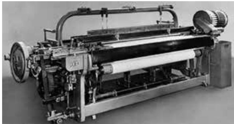
اولین ماشین بافندگی دورنیر ۱۹۵۰

همکاری را مستمر، پر بهره و با موفقیت دانست. وی در انتها از حضور تمامی تولیدکنندگان و مسئولین در این سمینار تشکر نمود. پس از وی مدیر فروش منطقه ای دورنیر - تری دوسمان - به معرفی کمپانی دورنیر از بدو تاسیس تاکنون پرداخت. شرکت دورنیر به عنوان تولیدکننده هواپیما آغاز به کار نمود و در زمان خود بسیار موفق عمل نمود. ساخت اولین هواپیما با استفاده از فلز آلومینیوم، ساخت بزرگترین هواپیمای دنیا، ساخت سریع ترین هواپیمای ملخی دنیا، اختراع صندلی ایجکت، طراحی اولین هواپیمای عمودپرواز، نمونه ای